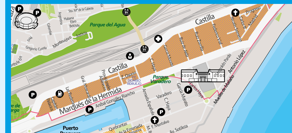
Detalle de la zona en el mapa de turismo de Santander Detail of the area on the Santander tourist map

Descargar mapa completo / Download the full map turismo.santander.es