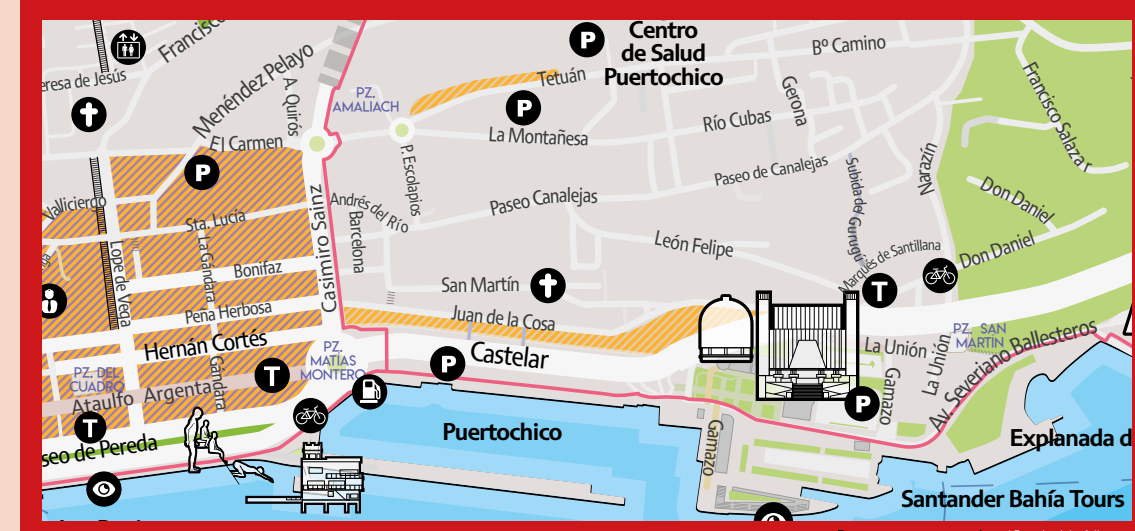
Detalle de la zona en el mapa de turismo de Santander / Detail of the area on the Santander tourist map